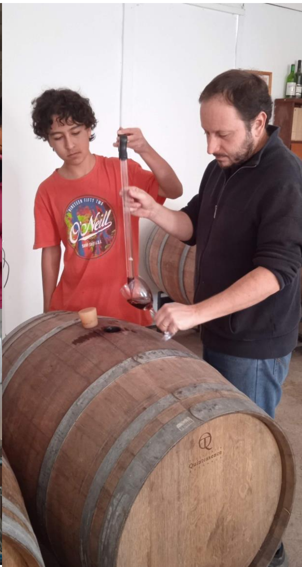
La producción total es de 5000 botellas al año. Actualmente contamos con 5 etiquetas.